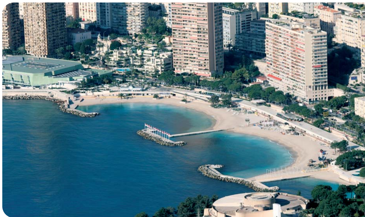
Les plages du Larvotto

Comme chaque année, la DAM fait installer deux filets anti-méduses dans les deux anses de la plage du Larvotto.