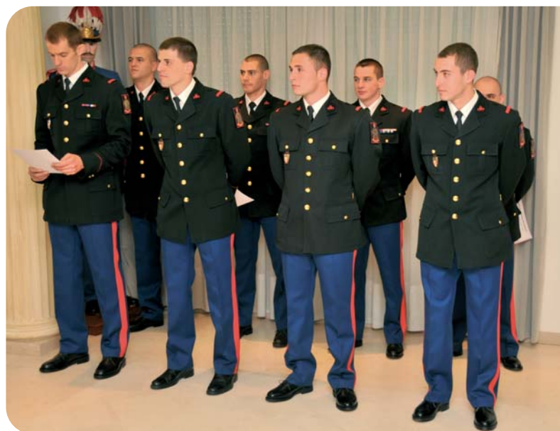
Les huit nouveaux Sapeurs-Pompiers de Monaco

Le 7 mai 2010, le Corps des Sapeurs-Pompiers de Monaco a accueilli huit nouveaux sapeurs-pompiers après cinq mois d'enseignement continu.