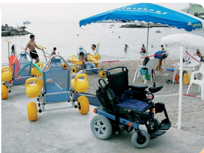
Le site Handiplage au Larvotto