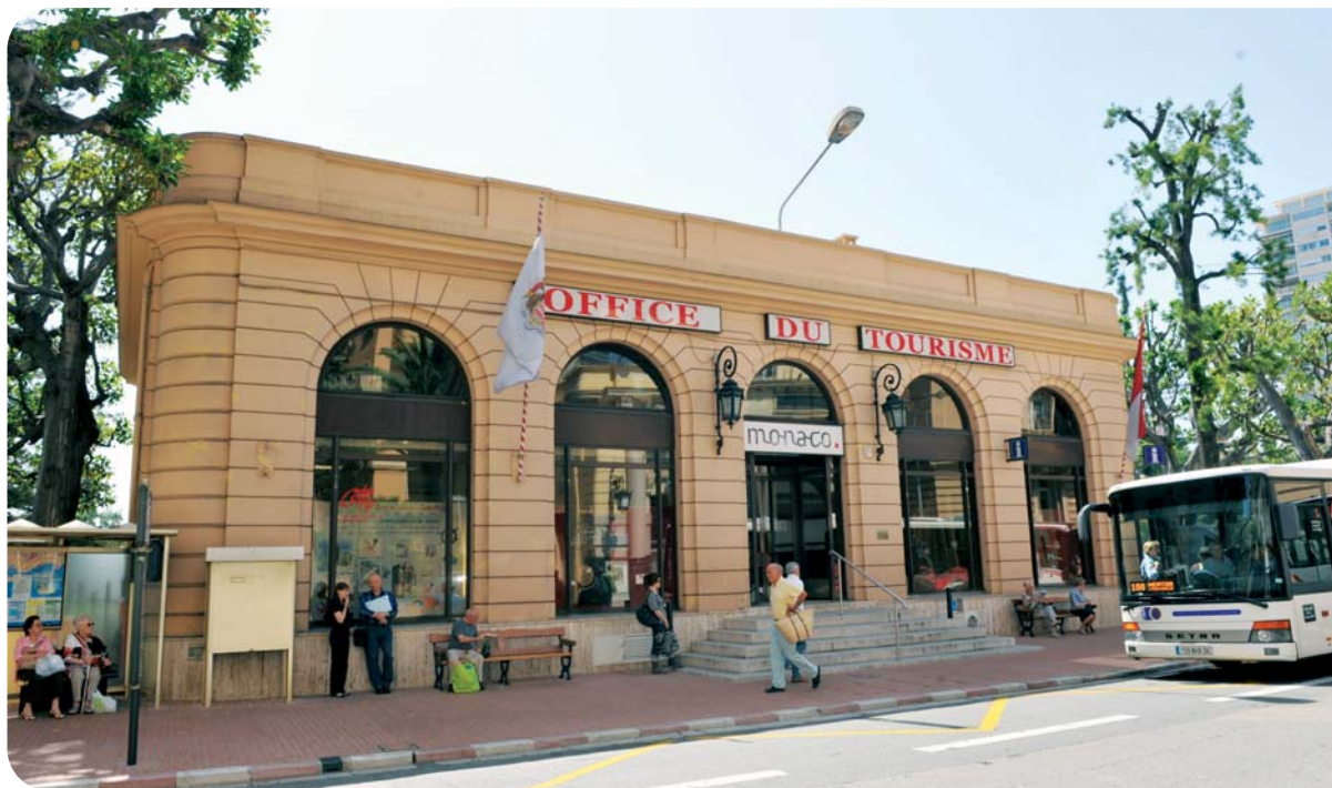
La Direction du Tourisme et des Congrès