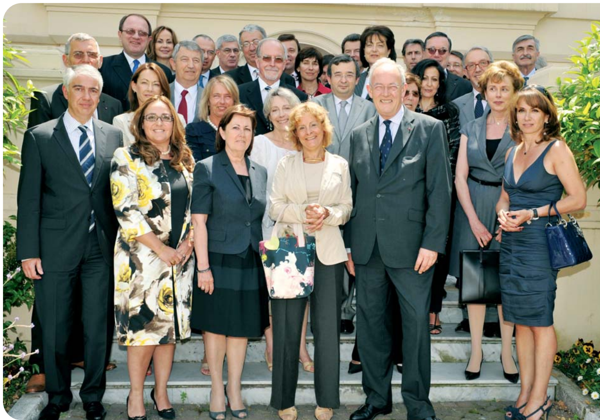
S.E. M Michel Roger entouré des Ambassadeurs, de leurs conjoints, des membres du Gouvernement et du Cabinet Princier

Dans le cadre de sa première participation à la Conférence Diplomatique annuelle, cette 5 e édition fut l'occasion pour le Ministre d'État Michel Roger de rencontrer tous les Ambassadeurs de Monaco à l'étranger, et de recueillir les missions accomplies par les Ambassades dans leur pays respectif.