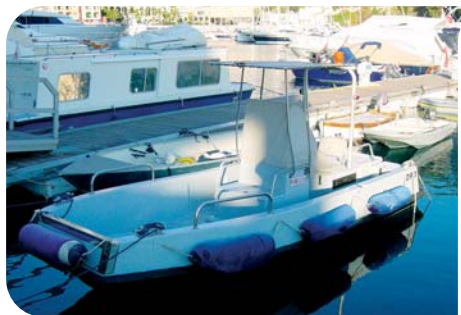
L'embarcation que la DAM met à disposition de la DE pour les prélèvements sanitaires

Du 1 er juillet au 30 août, la DE reconduit son programme de surveillance de l'algue microscopique Ostréopsis Ovata , entrepris depuis 2008, sur la plage du Larvotto,