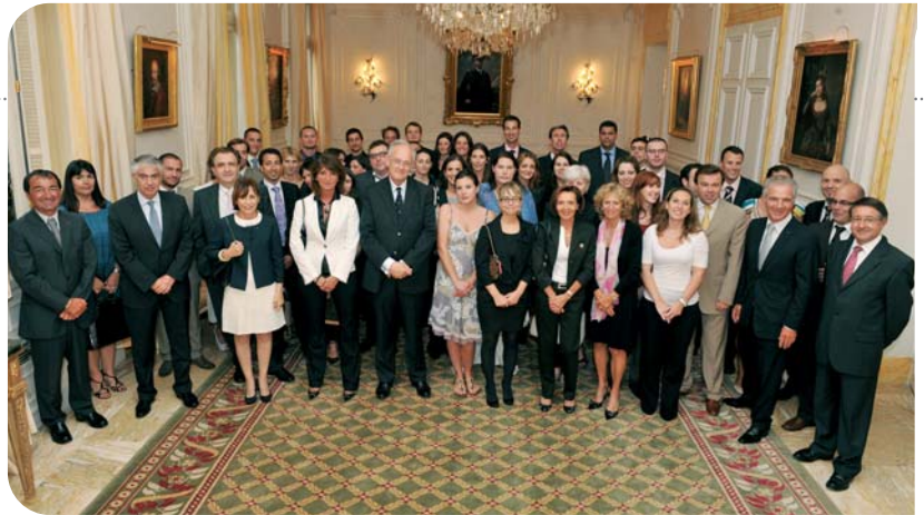
Autour de S.E. M. Michel Roger et des jeunes fonctionnaires, étaient réunis les membres du Gouvernement, du Secrétariat Général du Ministère d'État et de la DRHFFP

La soirée s'est poursuivie par des moments conviviaux de rencontre et d'échanges avec les jeunes fonctionnaires.