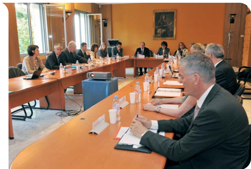
Séance de travail lors de la première journée du 31 mai 2010