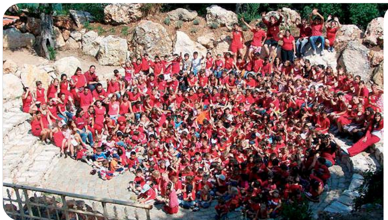
L'amphithéâtre du Centre de loisirs

Le Centre, délocalisé de la Principauté au lieu dit du « Terrain de l'Abbé », sur la commune de La Turbie est desservi en interne par un système de cars. Le Centre de Loisirs accueille quotidiennement 250 enfants, dans un cadre magnifique, aménagé en restanques sur plusieurs hectares de pinède, verdoyante et très arborée, équipé d'un amphithéâtre, d'un mur d'escalade et de nombreux terrains de sport. Pour les enfants qui ne partent pas en vacances, il est un lieu d'activités qui rime avec rires, chansons, jeux, découverte et partage. Le fonctionnement par groupes d'âge