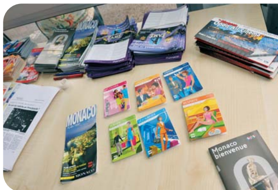
Brochures d'information données aux touristes

més au travers de réunions d'information et d'une demi-journée de mise en pratique au comptoir de la DTC, Bd des Moulins.