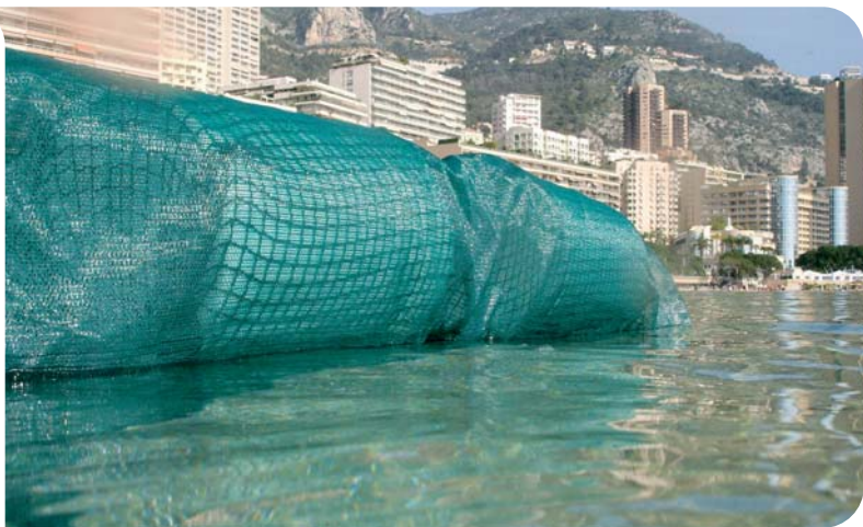
Le filet anti-méduses

Elle coordonne la pose, le suivi et la maintenance des filets ainsi que leur nettoyage hebdomadaire.