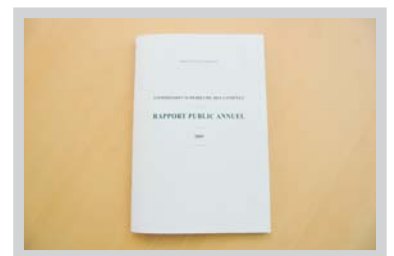
Rapport annuel 2009 de la Commission Supérieure des Comptes