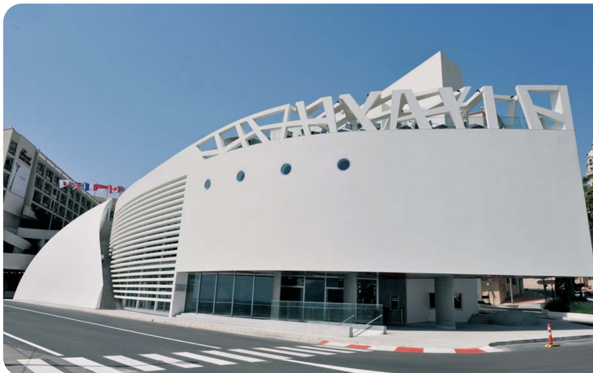
Complexe de loisirs pour les Jeunes de l'Anse du Portier, dénommé Ni-Box

En contrepartie, l'État perçoit un loyer annuel. Au terme de cette durée, l'État peut prolonger le contrat, le