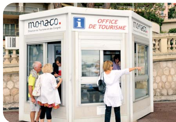
Le point information du Quai Albert I er

Parlant anglais et au moins une autre langue étrangère, ils sont for-